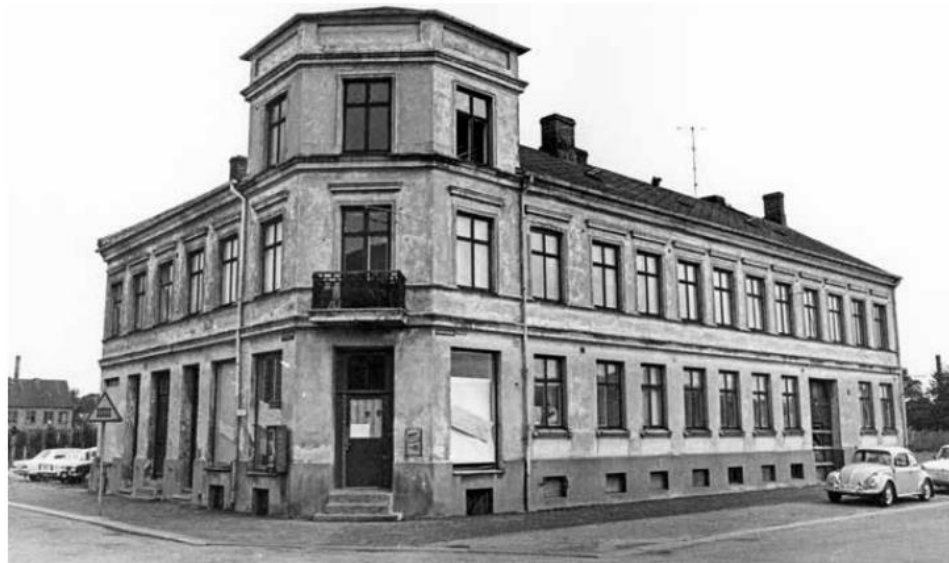
Ett av husen i kvarteret Argus västra, på hörnet av Bryggaregatan och Rönnowsgatan, strax före rivningen. Huset var uppfört 1887 efter ritningar av Mauritz Frohm. Foto Bernt A. Åkesson 1972. Helsingborgs museers samlingar.

Här bor han ungefär i ett år innan han flyttar till kvarteret Danmark och no. 18 i Helsingborg 1886 då frihetsgudinnan i New York har invigts, även här blir han kortvarig då de efter ytterligare ett år flyttar vidare till kvarteret Argus No. 10 i Helsingborg 1887. Varför det blev så korta tider på varje boende i Helsingborg kan bero på att man under denna tid i Helsingborg planerade om denna del av stads kärnan och rev mycket av det gamla och byggde nytt. Kanske var det till detta hus han flyttade?